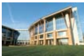
Campus corporativo en Mooresville, Carolina del Norte.

Cuando Lowe's abrió las puertas de un nuevo campus corporativo en Mooresville, Carolina del Norte, ingresamos a esa comunidad como un socio comprometido, otorgando una donación de incentivo de $2,5 millones para ayudar a construir